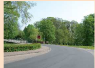
Ortsausgang Thedinghausen - möglicher Standort für ein Hotel?

Wer sich etwas leisten will, muss das Geld vorher auch verdienen. Warum nicht vor Ort? Deshalb hat die CDU Fraktion Thedinghausen einen Antrag zur Erstellung eines neuen Konzepts für die Wirtschaftsförderung gestellt. Wir wollen den Standort Thedinghausen durch die Ansiedlung von Unternehmen und die Schaffung bzw. den Erhalt von Arbeitsplätzen stärken. Dafür möchten wir die bisherige Wirtschaftsförderung im Rathaus Thedinghausen erweitern und als kompetenten Ansprechpartner für vorhandene und neue Unternehmen ausbauen.